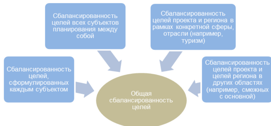
Рис. 2. Условия сбалансированности целей субъектов стратегического планирования инвестиционной деятельности в регионе

Проведенный анализ позволяет конкретизировать следующие условия, способствующие достижению сбалансированности целей в процессе стратегического планирования на региональном уровне (рисунок 2).